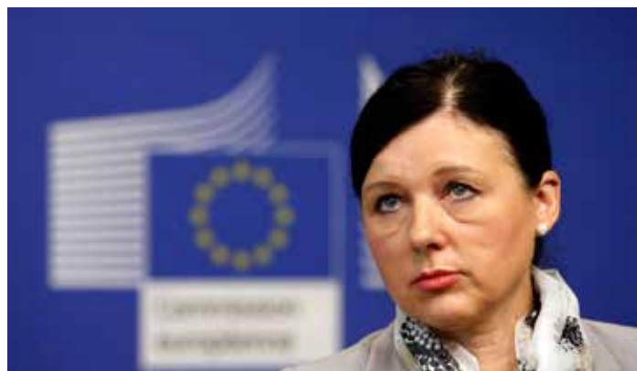
Věra Jourová, Commissione Europea

economici e di qualità è importante per l'equilibrio tra attività professionale e vita familiare, ma non sono solo i bambini che hanno bisogno di assistenza. L'aumento dei tassi di invecchiamento e di invalidità nell'UE fa salire la domanda di servizi di assistenza a lungo termine per gli anziani e le persone con disabili-