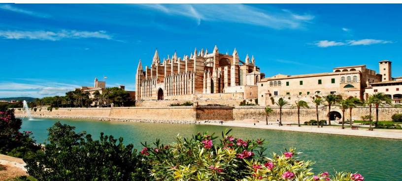
PALMA DI MAIORCA

ITINERARIO: ROME (CIVITAVECCHIA) - ITALY, CANNES - FRANCE, AJACCIO - CORSICA, BARCELONA - SPAIN, PALMA DE MALLORCA - SPAIN, CAGLIARI - SARDINIA - ITALY, ROME (CIVITAVECCHIA) - ITALY